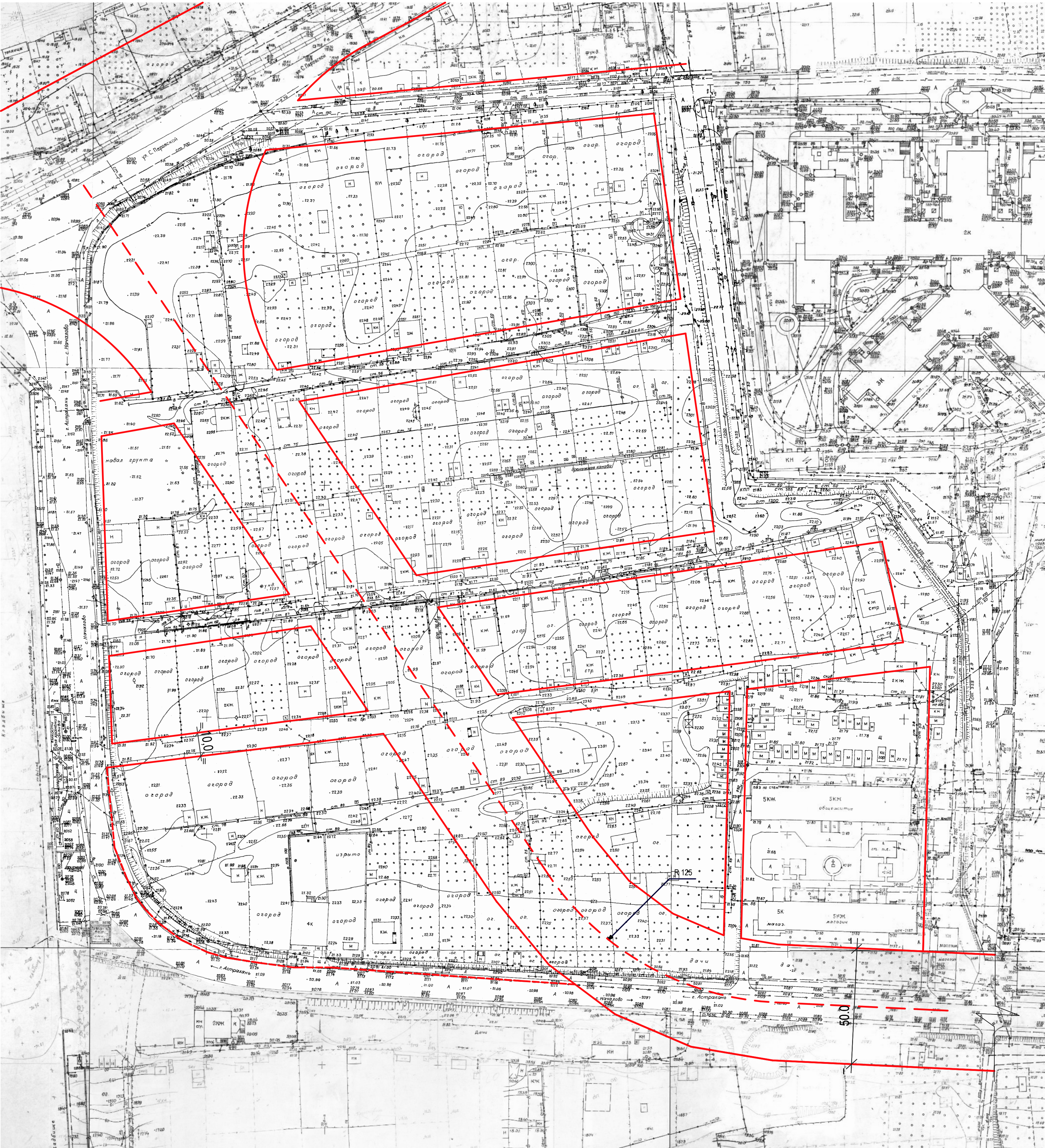
Схема проектируемых осей М 1:1000